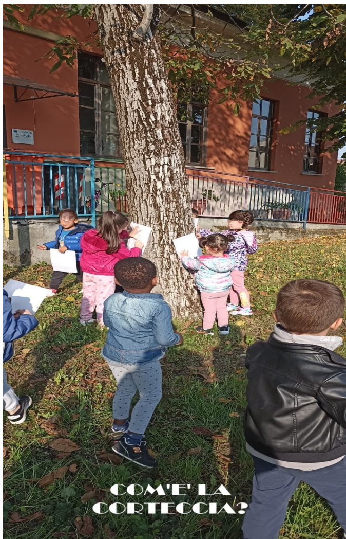
COM'E' LA CORTECCIA?