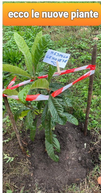
ecco le nuove piante